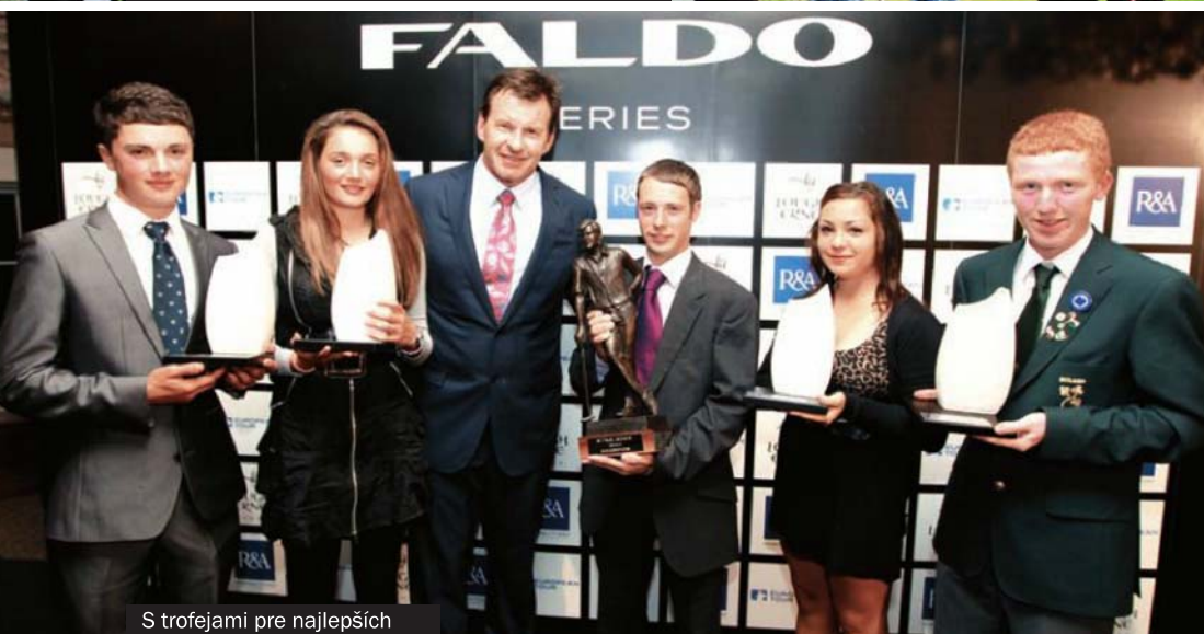
S trofejami pre najlepších