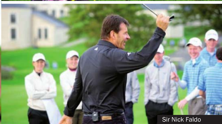
Sir Nick Faldo