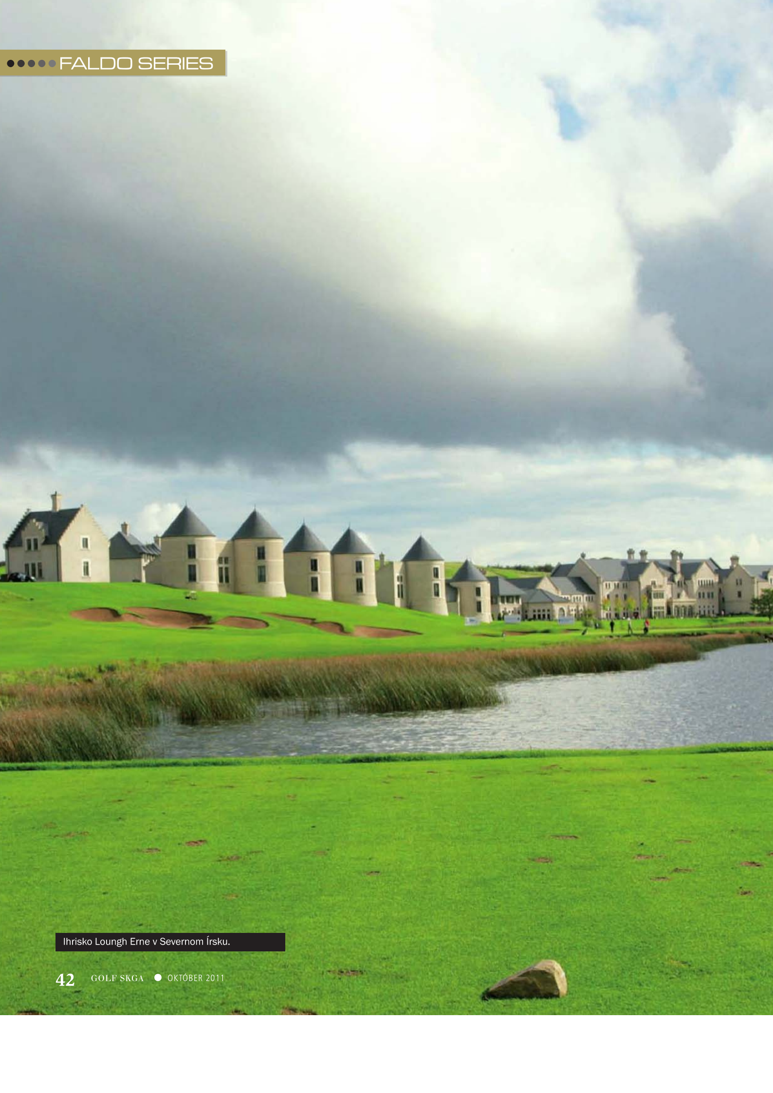
Ihrisko Lough Erne v Severnom Írsku.