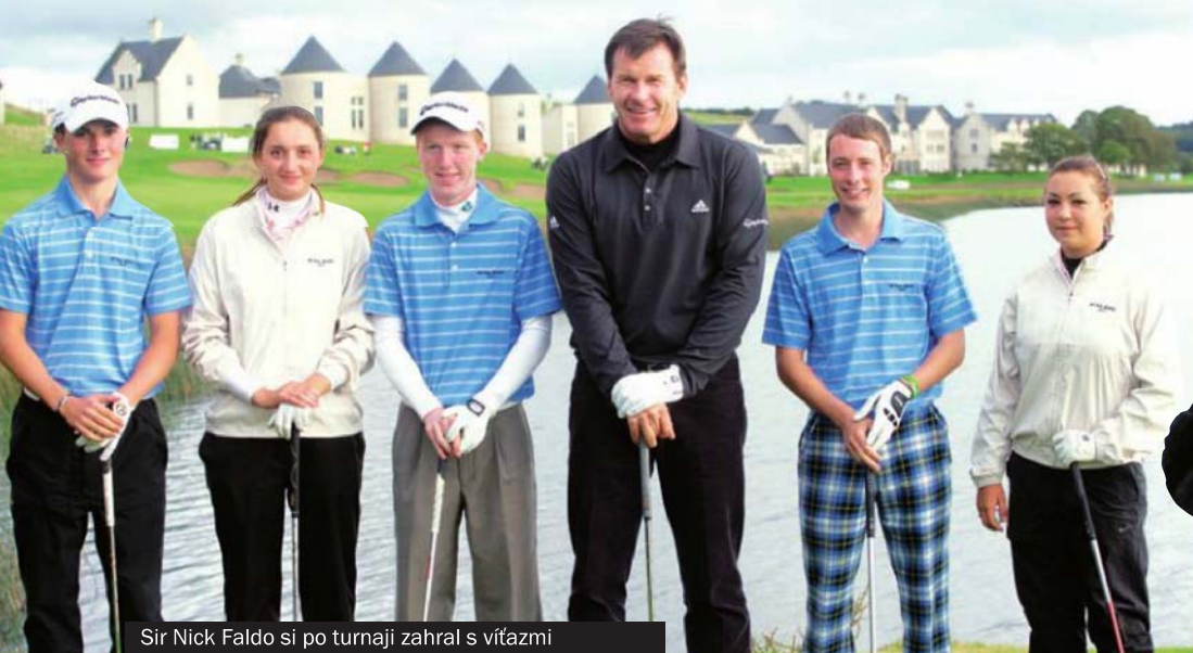
Sir Nick Faldo si po turnaji zahral s víťazmi